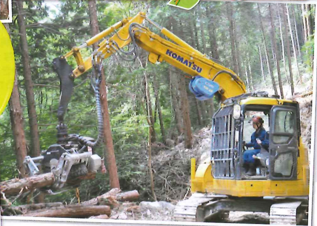
林野庁「緑の雇用」事業