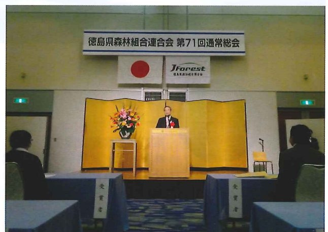
飯泉県知事ご祝辞