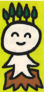
森林保険イメージキャラクター マモルくん