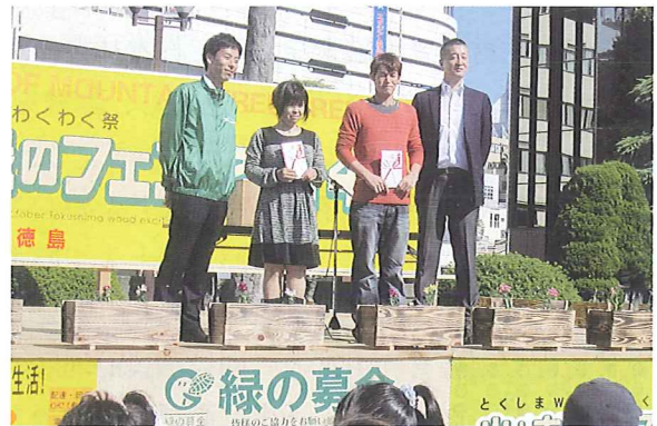
■農林中金からのプレゼント当選者