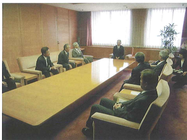
熊谷徳島県副知事