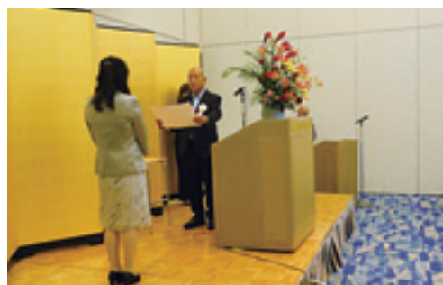
優良職員表彰の様子