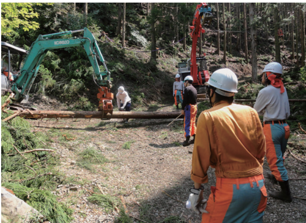
「緑の雇用」フォレストワーカー集合研修

発行 徳島市かちどき橋1丁目41番地 TEL 088-622-8158 FAX 088-626-5411 URL : http://www.toku-forest.com/ E-mail : info@toku-forest.com