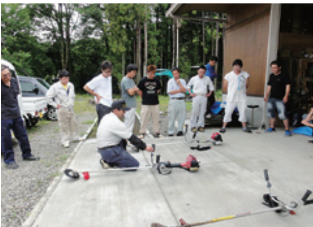
メンテナンス研修

なお、各年次の研修時間については、1年目：98時間＋安全講習等（計30日程度）、2年目：84時間＋安全講習等（計25日程度）、3年目：106時間＋安全講習等（計20日程度）となっており、大変充実した研修内容となっています。