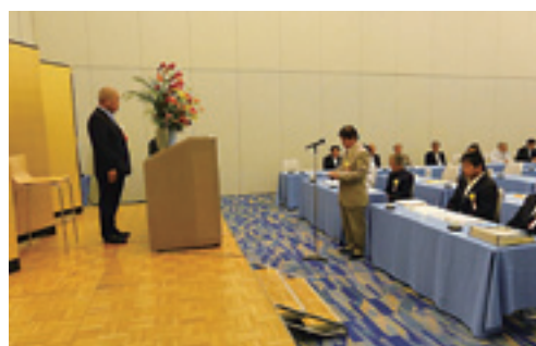
受賞者代表・謝辞